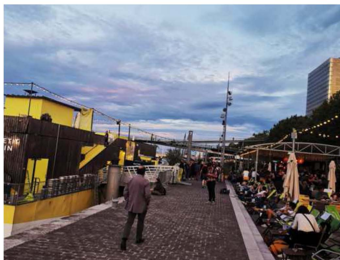
Port de la Gare (Paris, XIII e ). La péniche « Petit Bain », au pied de la bibliothèque François-Mitterrand, propose une programmation rock et électro pointue.