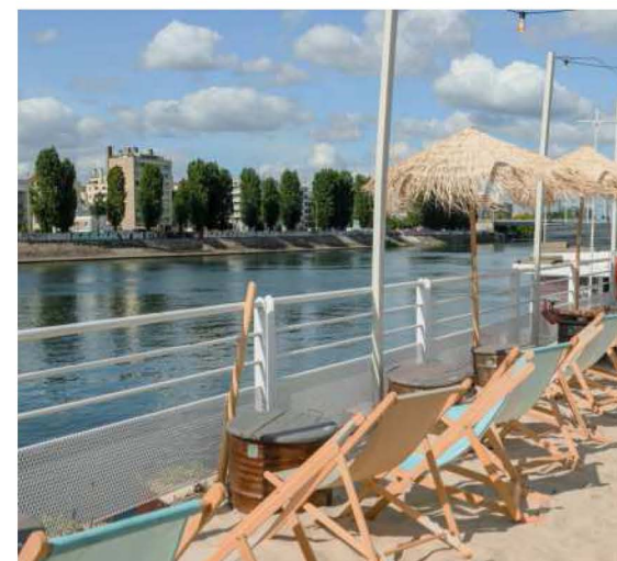
Quai Charles-Pasqua (Levallois-Perret, Hauts-de-Seine). La plage est ouverte jusqu'à fin septembre, en fonction de la météo.