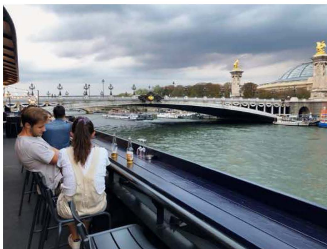
Port des Invalides (Paris, VII e ). Depuis le rooftop du « Flow », la vue sur la tour Eiffel, le pont Alexandre-III ou le Grand Palais, est imprenable.

Le long du bassin de la Villette à Paris (XIX e ), la péniche « Antipode » mêle les ambiances : dans la cale, des concerts rock, folk, flamenco... Sur le pont, vous pourrez déguster une cuisine « sans chichi », avec des produits artisanaux, locaux, à prix abordables.